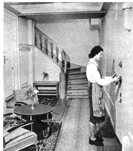
Eingang zum Saferaum