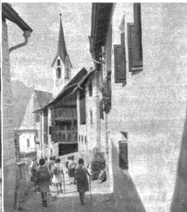
Guarda - Strassen mit prächtigen, alten Bündner Häusern

Landschaften charakterisieren sich nicht nur durch ihre geographische Gestalt, Menschen, Häuser, Bebauung geben ihnen Ausdruck, Inhalt und Leben. Wie sehr aber das gesamte Dasein der Bewohner einer Landschaft und mit ihm ihr Wohnen, ihre Baukunst, ihre Beschäftigung von ihrer geographisch bedingten Umwelt abhängen, wird einem erst so recht bewusst, wenn wir einige Zeit in einem Lande selbst zugebracht haben.