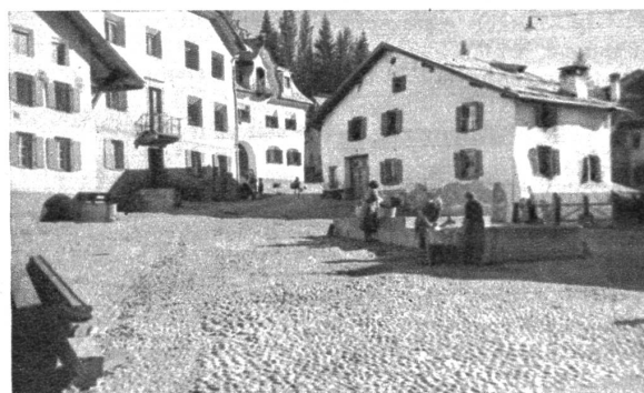
Dorfplatz in Schuls