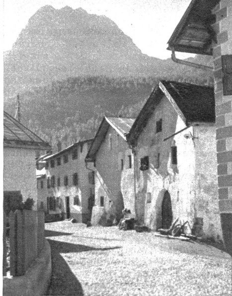
Dorfstrasse in Schuls