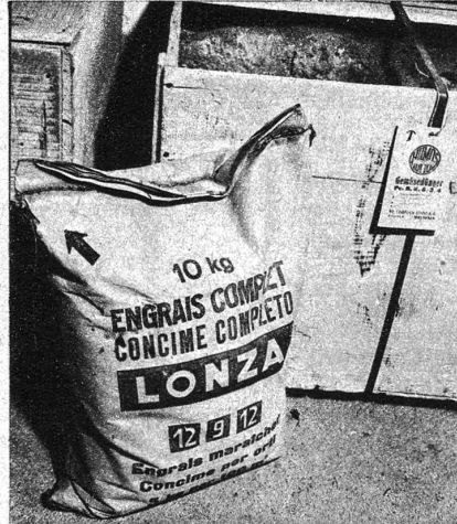
Zur Aufbewahrung von Kunstdüngern sollte man wenn möglich eine gedeckte Holzkiste verwenden, denn in Papier- oder Jutesäcken nimmt der Dünger zu rasch an Feuchtigkeit auf, wird knollig und lässt sich nicht mehr gut streuen