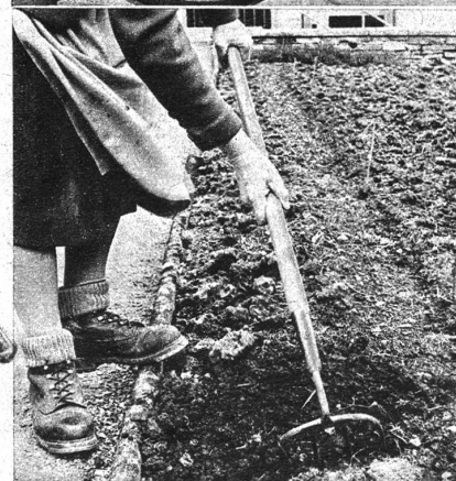
Sofort nach dem Streuen wird der Kunstdünger leicht, mit dem Kräuel in die Erdkrume eingekräuelt