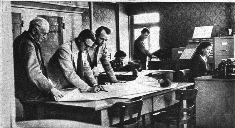
Besprechung auf der Gemeindeschreiberei