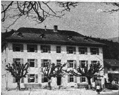
Die Gemeindeschreiberei im alten Schulhaus. Zentrum der Ortschaft

Doch Lengnau besitzt noch andere Erdschätze. Seit viel über hundert Jahren wird in der Nähe des Dorfes Huppererde (von der wir an anderer Stelle schon berichtet haben) gewonnen, die vor dem ersten Weltkrieg wagonweise nach Deutschland, Oesterreich und hauptsächlich Italien verschickt wurde. Seit Beginn des zweiten Weltkrieges ist die Gewinnung stark zurückgegangen und die Versendung nach fremden Ländern fast ganz eingestellt worden. Vielleicht dass in kommenden Jahren diese Erdschätze wieder mehr zu Nutzen gezogen werden.