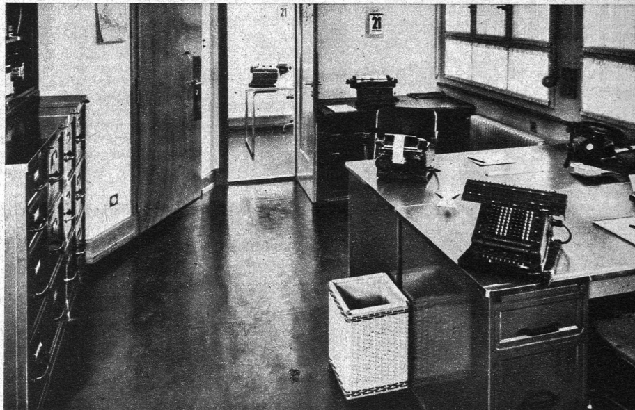
Oben: Das modern eingerichtete Büro. Unten: Ein grosser Teil der Herstellung ist immer noch in den Händen guter und zuverlässiger Meister