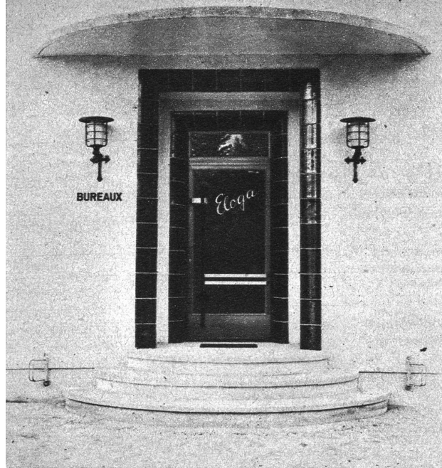
Der Büroeingang zur Fabrik