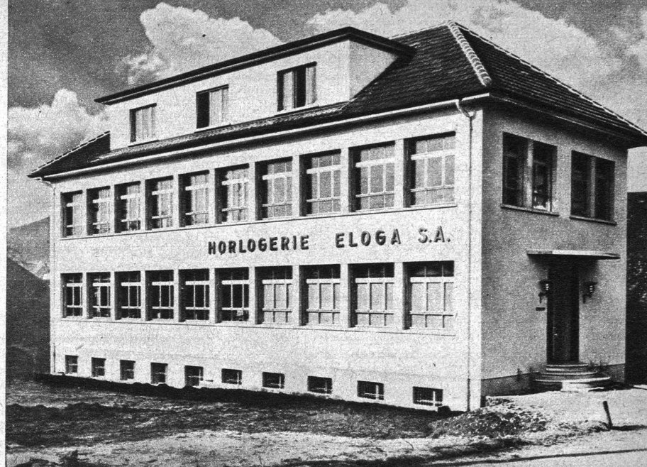
Die helle und sonnige Fabrikanlage der Eloga AG in Lengnau