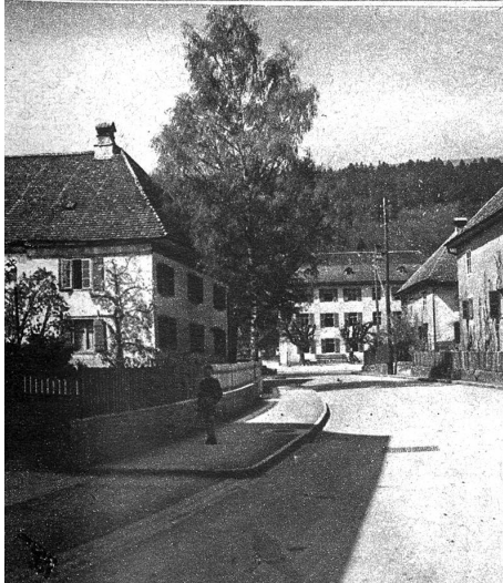
Die Hauptstrasse ist natürlich auch die eigentliche Geschäftsstrasse des Dorfes