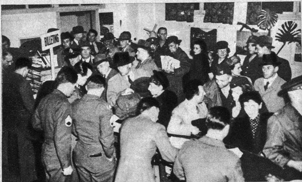
Die Russen haben in ihrem Bestreben, ihre westlichen Alliierten aus der früheren Reichshauptstadt, die mitten in der sowjetischen Besetzungszone liegt, herauszubekommen, die amerikanischen, französischen und englischen Militärszüge in Helmstedt an der Zonengrenze aufgehalten. Nach längeren Verhandlungen mussten die Züge mit Truppen, alliierten Beamten und deren Angehörige zurückgeführt werden, worauf sich im militärischen Flughafen der Amerikaner in Frankfurt am Main das in unserem Bilde gezeigte Gedränge ergab. Alle diese Menschen wollen nun mit dem Flugzeug nach Berlin gebracht werden.

Würde diese Aufgabe einmal gelöst (allen, die vor wenigen Jahren darüber als von einer Utopie sprachen, möchte man sagen, dass unter der Sonne nichts unmöglich sei), dann müssten all die Marktereien um die Verteilung der Lasten sich leicht in Minne schlichten lassen. Aber eben, man rechnet aus, dass man die Tilgungssteuer gar nicht tragen könne. Und die Gegner, welche finden, die weitere Belastung der Konsumenten sei untragbar, rechnen aus, dass die Besitzenden die Tilgungssteuer mehr als sicher tragen können. Dass beide Lager viel leichter tragen, was man ihnen heute zugemutet hat, falls unsere jetzige Konjunktur noch auf Jahre hinaus weitergeht, ja dass wir mit steigendem Wohlstand und immer erhöhten Reallöhnen immer leichter tragen, das eben wäre zu beachten. Wer aber findet den rich-