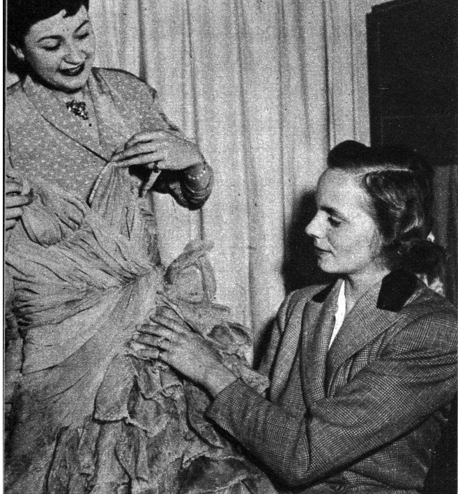
Die Braut Ex-König Michaels von Rumänien, Prinzessin Anna von Bourbon-Parma, ist gegenwärtig in Paris mit der Zusammenstellung ihrer Braut-Aussteuer beschäftigt. — Unser Bild zeigt Prinzessin Anna bei der Prüfung eines Abendkleides «chez Raphaële».