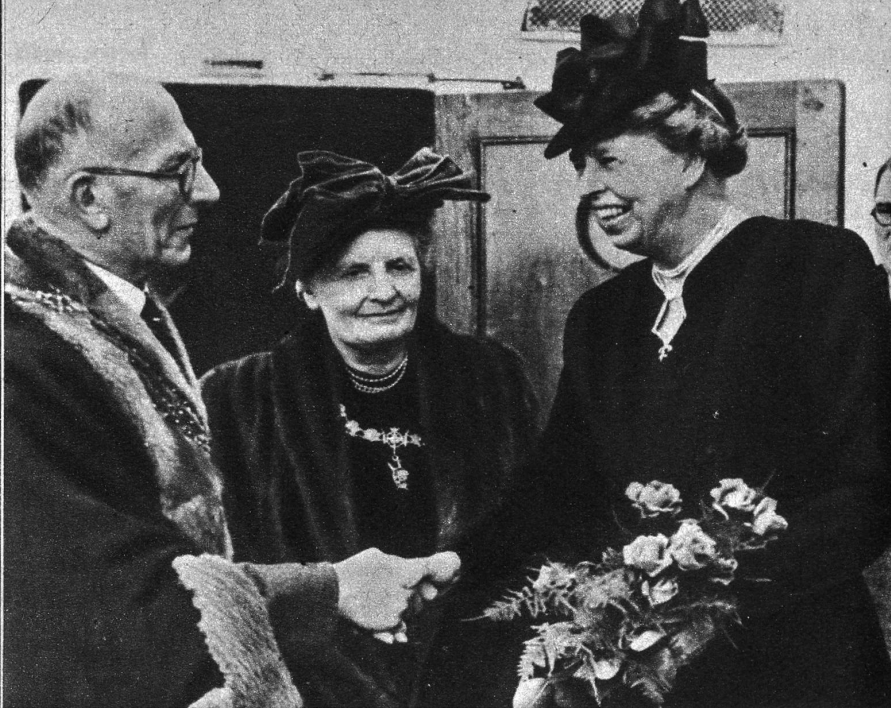
Die Witwe des verstorbenen Präsidenten der Vereinigten Staaten, Eleanor Roosevelt, ist mit dem Dampfer «Queen Elizabeth» in England angekommen. Frau Roosevelt wird in London Gast der königlichen Familie sein und im Buckingham Palace wohnen. Am 12. April wird sie das Denkmal ihres verstorbenen Gatten in Grosvenor Square enthüllen. — Unser Bild zeigt die Begrüssung der früheren «First Lady» von Amerika durch den Bürgermeister der Hafenstadt Southampton, Frank Dippen, und dessen Gattin (Mitte).