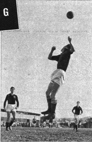
Wiederaufnahme des Sportbetriebes Schweiz: Deutschland. Universität Bonn 1:4 (Fussball). — Unser Bild zeigt eine Kopfabwehr am Berner Tor.