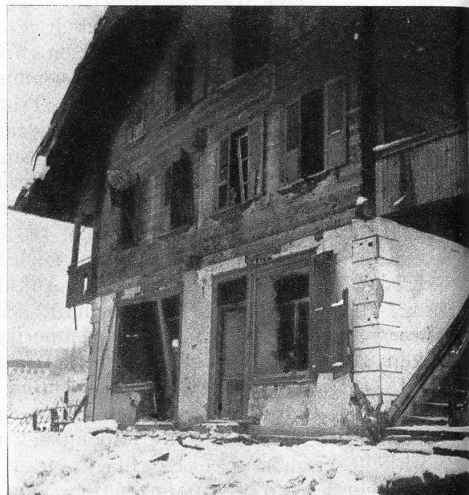
Wie im Kriege... das Haus mit dem Konsumladen, dessen sämtliche Fenster eingedrückt wurden, mit demolierten Rahmen und voller Geschosstreffer