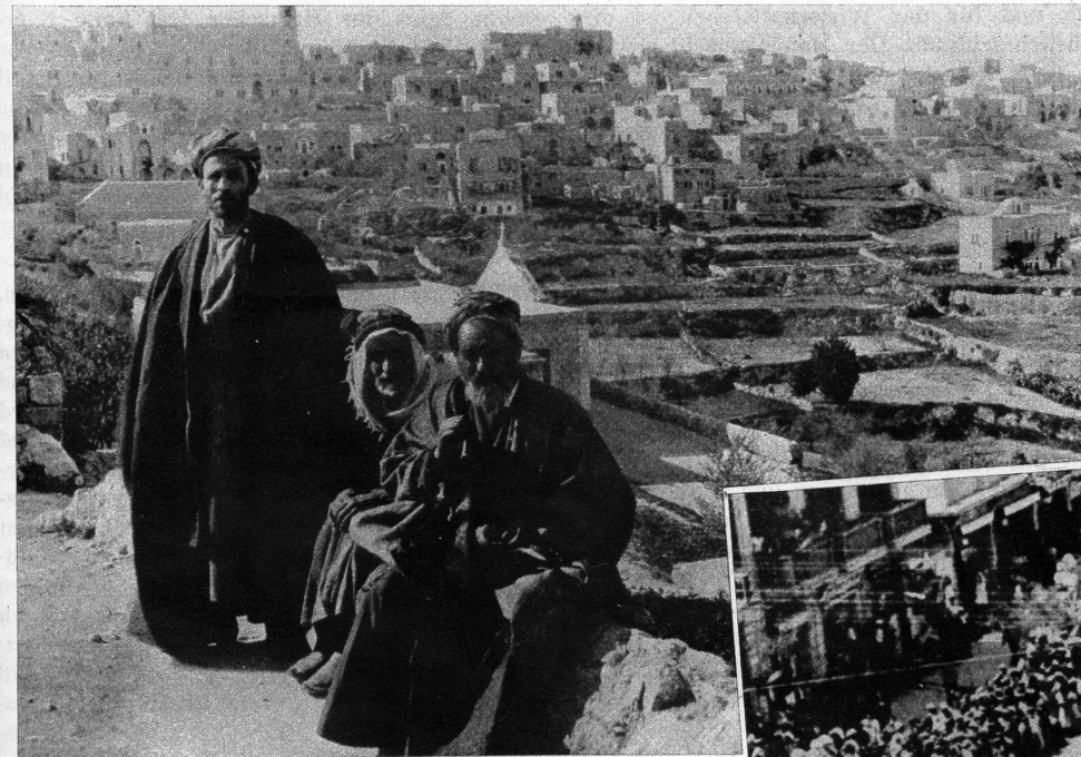
Bethlehem, die arabische Stadt, soll im arabischen Territorium bleiben

dem Grunde, weil Amerika damals wenigstens noch sehr weit weg war und England durch seine vorderasiatische Vormachtstellung Nachbar geworden war. Amerika und Arabien sind unterdessen Partner geworden, und es ist eine Tatsache, dass Amerika für Arabien in den letzten zehn Jahren mehr getan hat als England dies in den letzten fünfzig Jahren vermochte oder wollte. Dieses Resultat ist das Ergebnis einer amerikanisch grosszügiger geführten Politik, das Fehlen von Vorurteilen und – Verträgen.