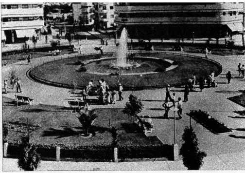
Dizengoff Circle in Tel Aviv – hier trifft man sich am kühlen Abend zur Promenade und zur politischen Diskussion