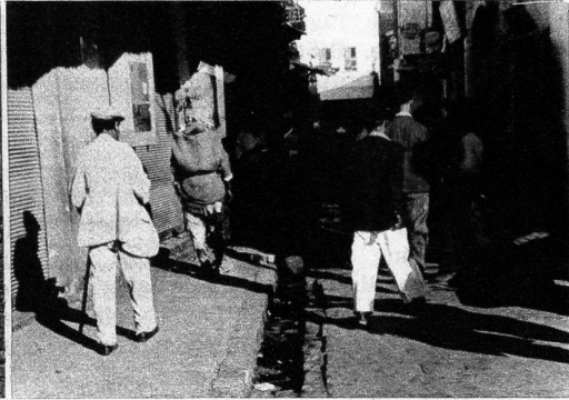
Strassenbild aus Jaffa, der rein arabischen Stadt neben Tel Aviv. Das enge Gebiet zwischen Tel Aviv und Jaffa ist bereits zum Niemandsland erklärt worden und dort finden gegenwärtig bereits regelrechte Kämpfe statt