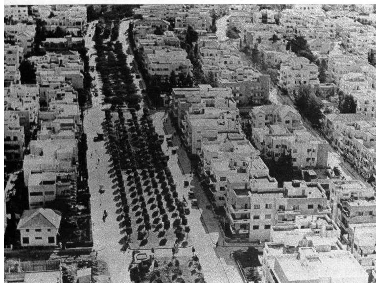
Tel Aviv, die Stadt des Frühlings, ein Sammelsurium von Kubismus und Futurismus, die Welthauptstadt des Judentums. In New York allein leben mehr Juden als in Palästina, trotzdem schaut das Judentum nach Tel Aviv als Hauptstadt «der Bewegung»

flussgebiet — man denke an den Irak, Transjordanien und Palästina —, ist durch die Schwächung Englands, dem Einfluss der Krone entglitten und mehr oder weniger unter den sternengeschmückten Hut Onkel Sams geraten. Ibn Saud, der Herr über 15 000 000 Mohammedaner in Saudi-Arabien, zog die amerikanischen Oelmänner den britischen vor, schon aus