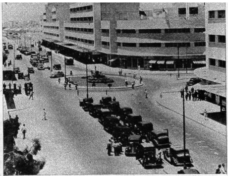
Haifa, modern und aktiv, aber ebenfalls in feindliche Lager aufgespalten