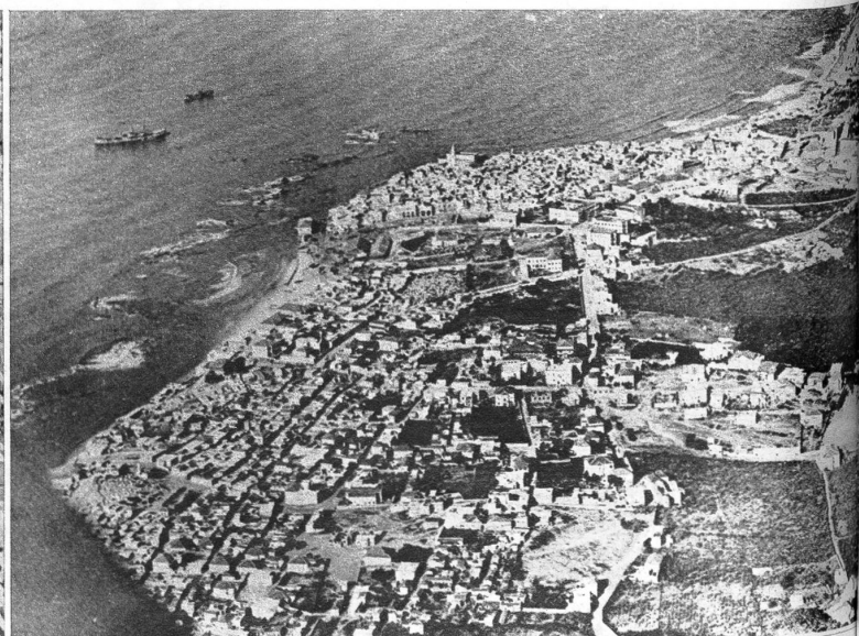
Luftbild der Stadt Jaffa, der Schwester Tel Avivs. Während Tel Aviv neu und eine Stadt des erdenklichsten Fortschrittes ist, bleibt Jaffa konservativ und rein arabisch