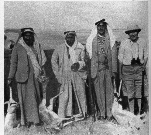
Der Araber, von Hause aus ein Krieger und Kämpfer, durch seine Religion zur Unduldsamkeit erzogen, brennt darauf, in Palästina in den Krieg ziehen zu können Links: Jerusalem soll zur internationalen Zone erklärt werden, damit auch in Zukunft die Pilger aus allen Ländern die heiligen Städte besuchen können

D er einzige positive Beschluss, der bis heute durch die Verhandlungen an der UNO gefasst worden ist, besteht im Einverständnis der Aufteilung Palästinas. Ein arabisches Land wird nach jahrhundertelanger Vergewaltigung durch Türken und Mandatmacht erneut der Unruhe ausgeliefert, eine Operation wird ausgeführt, von der man zum vorneherein weiss, dass sie dem