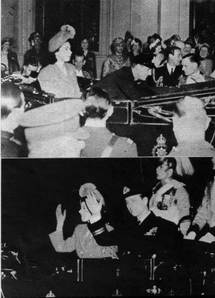
Das Paar auf der Fahrt nach der Waterloo-Station, wo die beiden einen Sonderzug bestiegen.

Als nach den Hochzeitsfeierlichkeiten im Buckingham-Palast die Neuvermählten den Wagen bestiegen wollten, — die Kronprinzessin hat ihr Brautkleid mit einem blauen Reisekostüm vertauscht — der sie nach dem Waterloo-Bahnhof und von dort auf die Besetzung der Mountbattens in Broadlands führen sollte, setzte auf das abgungelose Paar ein wahres Bombardement mit Rosenblättern ein, woran Könige und Königinnen und Prinzen beteiligt waren