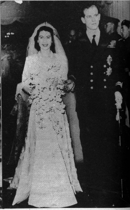
Diese Aufnahme zeigt das jung vermählte Ehepaar kurz nach der Trauung im Buckingham-Palast, wo das Vermählungsmahl eingenommen wurde.