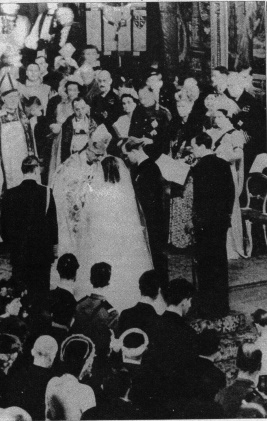
Der feierliche Moment in der Westminsterabtei verlässt der Brautgänger die mit Gästen angefüllte Kirche. An der Spitze erkennt man das Brautpaar, gefolgt von den acht Brautjungfern.