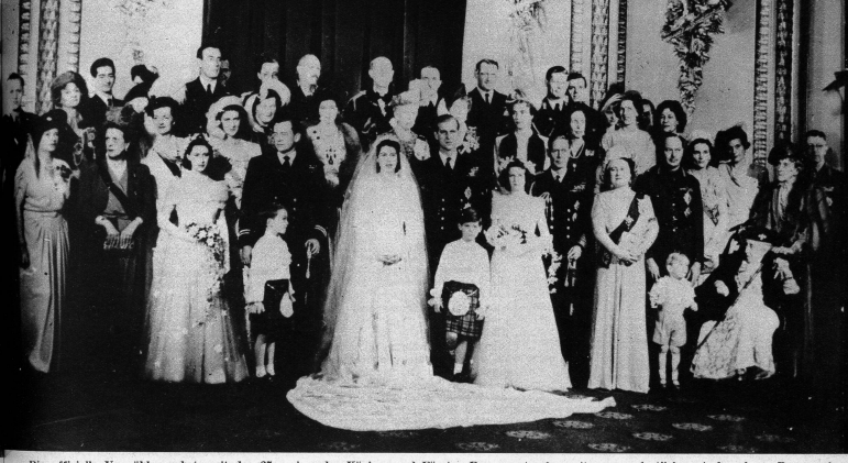
Die offizielle Vermählungsphoto mit den 27 regierenden Königen und Fürsten Europas. An dem mit ausserordentlichem Aufwand von Pomp und Prunk begangenen Hochzeitsfeste im englischen Königshaus nahmen sämtliche regierenden Könige und Fürsten Europas teil. Unser Bild zeigt: 1. Reihe (v. l. n. r.): unbekannt, Prinzessin André von Griechenland (Mutter des Brautgämers), Prinzessin Margreth, Trauzuge Marquis of Melford Haven, Fage Prinz William von Gloucester, die Braut, Brautgänger, Fage Prinz Michael of Kent, Prinzessin Alexandra von Kent, der König George, Königin Elisabeth, Herzog von Gloucester, vor ihm sein Sohn Richard, Mutter der Königin Elisabeth. 2. Reihe (v. l. n. r.): dritte (in weiss) Countess Mountbatten, Herzogin von Kent, Kronprinzessin Juliana, Königin Frederik von Griechenland, Königin Mary, Edkönigin Ema von Spanien, Königin Ingrid von Dänemark, Kronprinzessin von Schweden, Herzogin von Aosta, neben dem Herzog von Gloucester die Herzogin von Gloucester, ganz aussen Königin von Norwegen und Kronprinz von Schweden. 3. Reihe (v. l. n. r.): Peter von Jugoslawien, Earl Mountbatten, Prinz Bernhard der Niederlande, König Haakon von Norwegen, Prinz George von Griechenland, zweitnächster König Frederik von Dänemark, König Michael von Rumänien