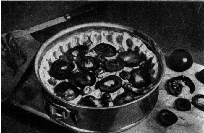
Eine Käsetorte ist sehr pikant und sättigend

Festtagstorte aus Mürbeteig. Eine Tortenform wird mit Mürbeteig ausgelegt (Herstellung: 250 g Mehl, 125–150 g Butter, 1 Ei, eine Prise Salz, eine halbe Eierschale voll Wasser, nach Belieben 20–50 g Zucker). Auf den Mürbeteigboden setzt man einen Rand von Makronenmasse (3 grosse Eiweiss, 250 g geriebene Mandeln, 250 g Staubzucker, die Schale einer halben Zitrone) in kleine Höckli, die man jedes mit einer geschälten Haselnuss belegt. In die Mitte legt man Früchte und backt die Torte in guter Hitze.