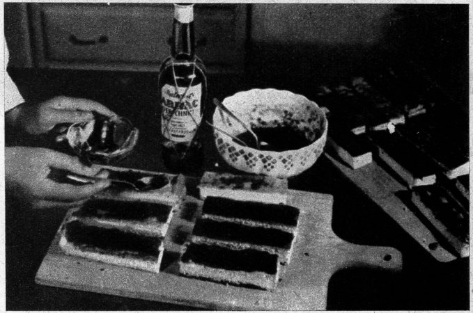
2 Die Punschnitten werden mit Marmelade gefüllt und mit Rum beträufelt

4 Einfache Windbeutelchen: Dazu braucht man 1/2 Tasse Mehl, 1/2 Tasse Milch, 1 Ei und 7-8 gut gefettete Backförmchen. Milch und Ei werden langsam zum Mehl gerührt und das Ganze 5 Minuten geschlagen, bis der Teig Blasen wirft. Dann werden die Förmchen halbvoll mit Teig gefüllt und 20-25 Minuten gebacken. Man darf ja nicht zu früh nachsehen, sonst fallen die Windbeutelchen wieder zusammen. Die fertigen Windbeutelchen nimmt man aus der Form und kann sie mit Vanillesauce essen oder mit Konfitüre oder auch geschlagener Nidle füllen. Als pikante Beigabe zu einer kalten Platte kann man sie auch mit russischem Salat füllen.