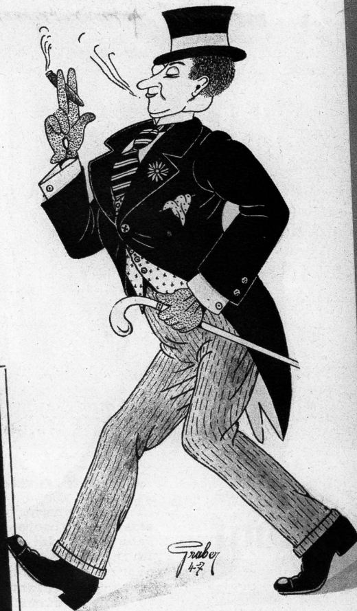
Herr Binggeli auf Freiersfüßen...

In jede waagrechte Kolonne ist die Silbe ER derart zu ergänzen, dass Worte mit folgender Bedeutung entstehen: Unterliegen / Tätigkeit, um ein Buch herauszugeben / zusammendrängen / Teilstücke eines zerbrochenen Gegenstandes / populärer Name eines Mädchens aus dem 1. Weltkrieg / sich aufregen / Vorratshaus