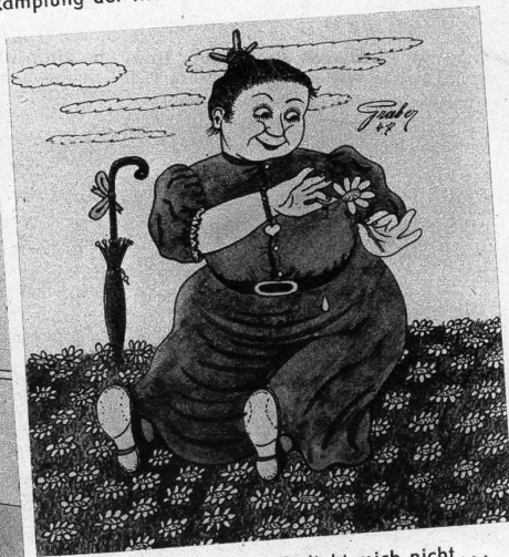
«... Er liebt mich... Er liebt mich nicht... Er liebt mich...»