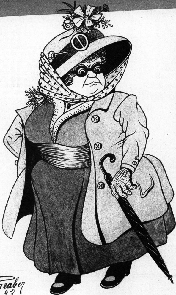
Die Präsidentin des Frauenbundes zur Bekämpfung der Modetorheiten