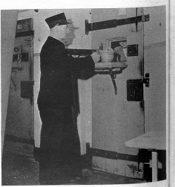
Ein Polizei-Wächter beim Abnehmen der Essgeschirre eines Zellinsassen. Diese essen, schlafen und verbringen ihre Freizeit stets in ihrer Zelle, so dass sie ausser der Arbeitszeit mit ihren Leidensgenossen nicht in Berührung kommen.

die sich dementsprechend aufführen und zu keinen besonderen Klagen Anlass geben. Die andern dagegen arbeiten in Zellen oder in den handwerklichen Innenbetrieben. Die Strafanstalt ist bis zu einem gewissen Grade auf dem autarken Prinzip aufgebaut, indem alle wichtigsten Bedarfsartikel selber hergestellt werden. So sieht man eine grosse Weberlei, eine Schneiderei zur Anfertigung der Anstaltskleider und anderer Arbeiten, eine Schusterlei, eine Korbmacherwerkstatt sowie eine Schreinerlei, die sogar Aussteuer auf Bestellung anfertigt, zur Verfügung. Andersorts besitzt Thorberg einen ausgedehnten landwirtschaftlichen Betrieb von insgesamt 400 Jucharten Umfang, mit 5 in der Umgebung verteilten Höfen sowie einer Alpweide. Gegen Ende ihrer Straftat werden die Leute nach Möglichkeit auf die von der Anstalt vielmehr unabhängigen Aussenhöfe verlegt, wo ihnen dann Gelegenheit zum allmählichen Anschluss an die menschliche Gesellschaft geboten ist. Diese Strafvollzugsmethode: Arbeit im Zellengebäude, dann im Freien und zuletzt auf den Einzelhöfen darf sicherlich als ein vorzügliches Mittel zur Erziehung angesehen werden.