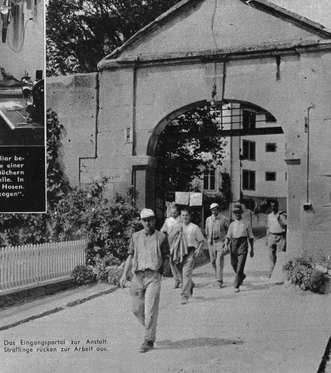
Das Eingangsportal zur Anstalt. Sträflinge rücken zur Arbeit aus.