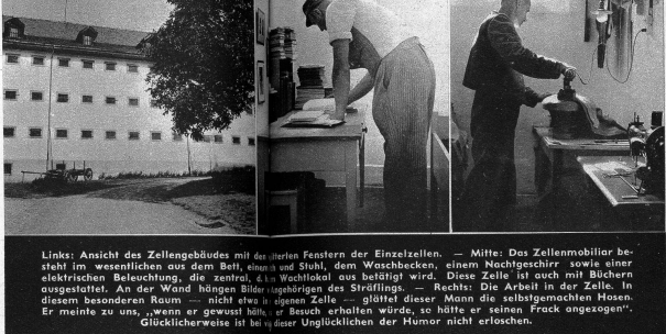
Links: Ansicht des Zellengebäudes mit den Fenstern der Einzelzellen. — Mitte: Das Zellenmobiliar besteht im wesentlichen aus dem Bett, einem Stuhl, dem Waschbecken, einem Nachtschreibtisch sowie einer elektrischen Beleuchtung, die zentral, das Wechsellicht ausbestrahlt wird. Diese Zelle ist auch mit Büchern ausgestattet. An der Wand hängen Bilder (gehörig des Sträflings). — Rechts: Die Arbeit in der Zelle. In diesem besonderen Raum — nicht etwa in eigenen Zellen — glüht dieser Mann die selbstgemachten Hosen. Er meint zu uns, wenn er gewusst hätte, Glücklicherweise ist bei dieser Unglücklichen der Humor nicht erloschen.

der gefährlichsten aller Strafen, der Verwahrung, eingewiesen. Es handelt sich hier also um die gefährlichsten Elemente der menschlichen Gesellschaft, was u. a. auch daraus hervorgeht, dass von den Verwahrten, als grösster Gruppe, jeder Mann durchschnittlich nicht weniger als 17 Vorstrafen auf dem Gewissen hat. Aber auch von den andern ist der grösste Teil vorbestraft. Wie sollen diese Unglücklichen gebessert werden? Die Erfahrung hat gezeigt, dass sich ein Erfolg keineswegs auf dem Wege der Absonderung, der dauernden Einzelhaft und der Arbeitserhaltung erreichen lässt. Heute weiss man, dass ein Ziel am besten dadurch erreicht werden kann, indem man den Gefangenen einige Zeit in Einzelhaft belässt und dann allmählich in den Arbeitsprozess der Anstalt einschaltet, wo er unter strenger Beaufsichtigung sich in die herrschende Disziplin einfügen lernt. Hält er sich gut, so kann der Sträfling frühestens nach zwei Dritteln der Strafdauer (bei lebenslänglichem Zuchthaus nach 15 Jahren) bedingt entlassen werden, wobei er während einer gewissen Dauer unter Aufsicht gestellt wird. Leider steht in Thorberg infolge Platzmangel nicht jedem Sträfling, wie dies zur Erreichung