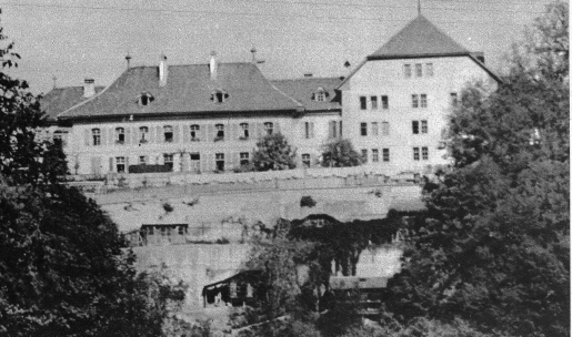
Ansicht der Strafanstalt von der Zufahrtsstrasse her. In der Mitte das Verwaltungsgebäude.

bermische Strafanstalt Thorberg, in der die gefährlichsten Verbrecher ihre Strafen absitzen, mag über die Verhältnisse im bernerischen Strafvollzug von besonderem Interesse sein. Stolz und trutzig steht das ehemalige mächtige Kartäuserkloster Thorberg auf der waldumtengenen Sandsteinfelsen und blinkt mit seinen weissgeläuchten Mauern gar majestätisch in das einsame Krauchthal hinauf. Das 1393 gegründete Kartäuserpriorat, übrigens die letzte Klostergründung auf bernerischem Landgebiet, wurde im vergangenen Jahrhundert zur Strafanstalt umgebaut und ist heute dem Berner unter dem einfachen Namen «Zuchthaus» bekannt. Die Strafanstalt Thorberg beherbergt heute gegen 250 Insassen, Landesverratler, Mörder, Räuber, Stillschlichter usw. Es werden grundsätzlich nur Sträflinge mit Zuchthausstrafen von über drei Jahren, mit Gefängnisstrafen im Rückfall und bei