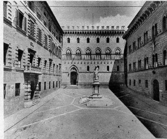
Piazza Salimbeni in Siena: drei Paläste, drei Jahrhunderte italienischer Kultur und Kunst. In der Mitte typische Seneser-Gotik des Trecento, rechts Florentiner-Renaissance des Quattrocento und links römische Spätrenaissance des Cinquecento

Je ungestümer und achtungsloser sich ein Pferd in der geheiligten Stätte gebärdet, desto grösser sind seine Aussichten auf den Sieg! Danach geht's bei Trommelschlag, Fanfarenklängen und Fahnen-schwingen durch die vollgepfropften Gassen auf den Domplatz, wo sie vom Erzbischof, dem Beschützer aller Contrade, gesamthaft den Segen erhalten. Inzwischen hat sich die Piazza del Campo vor dem Rathaus mit Einheimischen und aus ganz Italien herbeigeströmten Fremden gefüllt, und unter einem atemraubenden Lärm der ausser Rand und Band geratenen Menge macht der historische Umzug auf der Piste eine Runde um den fiebernden Festplatz. Am Ende des Corteo wird von vier prächtigen Ochsen der sogenannte «Carroccio», d. h. der den Florentinern in der Schlacht von Montaperti Anno 1260, wo Dantes Vater auf Seite der Floren-