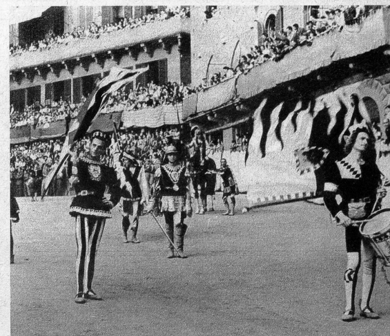
Oben: «Sbandieramento» heisst in der Sprache Sienas, der schönsten Italiens, unser echt schweizerisches Fahnen-schwingen — Links: Der Palio ist in vollem Gang. Es geht um die Ehre des Fantino, um den Ruhm der ganzen Contrada: forza, ragazzi!