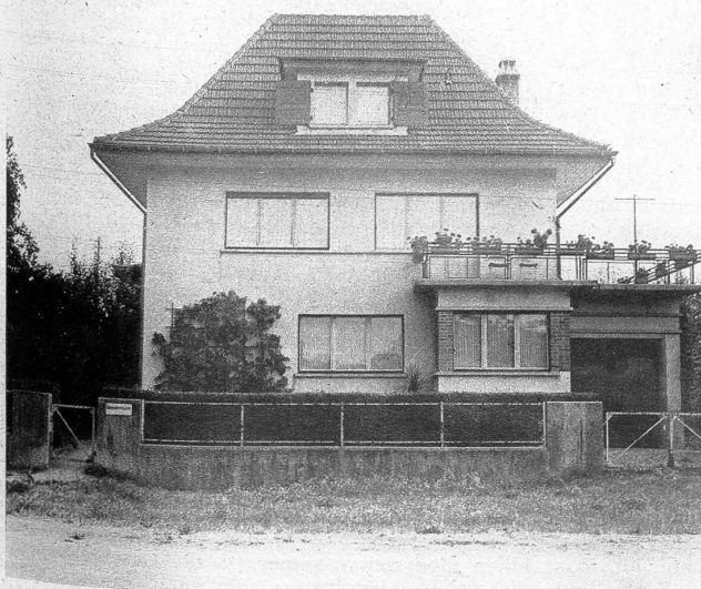
Die Gemeindeschreiberei beim Bahnhof