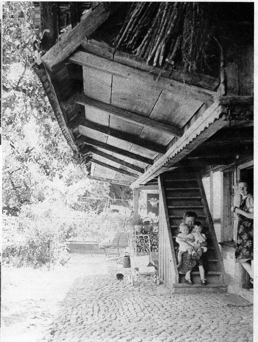
Ein heimeliger Ort