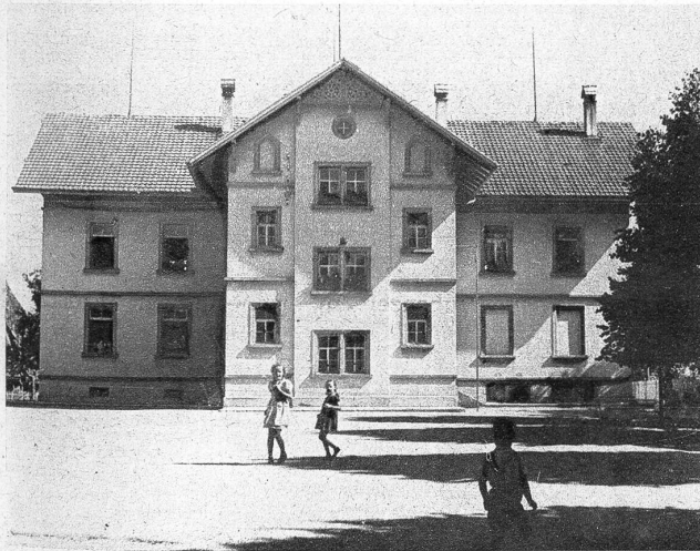
1892 wurde dieses Schulhaus für die Sekundarschule erbaut