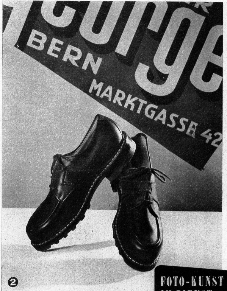
FOTO-KUNST IM DIENST DER WERBUNG