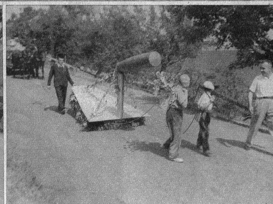
«Handwerk hat goldenen Boden». Links: Zimmerleute. Rechts: Die Maurerkelle