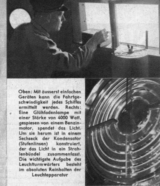
Oben: Mit äusserst einfachen Geräten kann die Fahrtgeschwindigkeit jedes Schiffes ermittelt werden. Rechts: Eine Glühfadentlampe mit einer Stärke von 4000 Watt, gespeist von einem Benzinmotor, spendet das Licht. Um sie herum ist in einem Sechseck der Kondensator (Stufenlinsen) konstruiert, der das Licht in ein Strahlenbündel zusammenfasst. Die wichtigste Aufgabe des Leuchtturmwärters besteht im absoluten Reinhalten der Leuchtapparatur