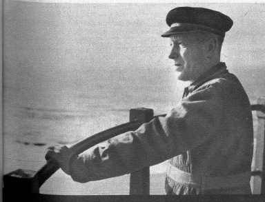
Links: Von der oberen Plattform aus blickt der Leuchtturmwärter über das unbegrenzte Meer. Rechts: Hinter ihm aber liegt beinahe ebenso ausgedehnt und verlassen die unfruchtbare Ebene. Nur der am Horizont gerade noch sichtbare Kirchturm zeigt das Vorhandensein von Menschen an.