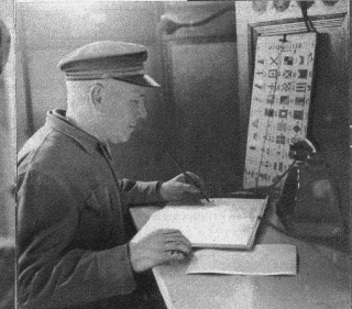
Alle Wahrnehmungen und der mit den weit draussen auf dem Meer vorbeifahrenden Schiffe geführte telegraphische Depeschwechsel wird in einem Rapportbuch genau eingetragen