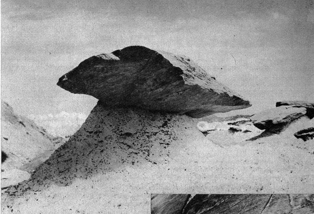
Gletschertisch auf dem grossen Aletschgletscher

Ihm fiel ein, dass sie einmal bemerkt hatte, Géran habe ihr mit dem Augenblick der Heirat das Spielen verboten. Welch grenzenloser Egoismus lag darin, ein Talent wie Sybil es besass, zu unterdrücken! Welche anmassende männliche Eitelkeit! Oder waren es sogar Minderwertigkeitsgefühle, Un-