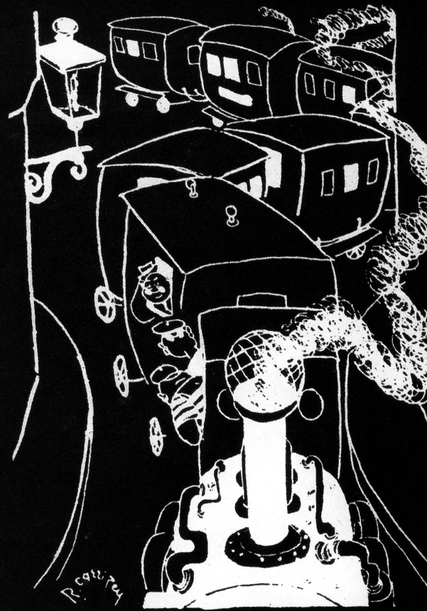
«Fahren wir nicht über den Bahnhof?» – «Wenn Sie wollen schon, aber dieser Weg ist direkter!»

Senkrecht: 1 Waldfrucht; 2 Fisch; 3 Schreibgerät; 5 Gebirge in Deutschland; 6 Backmittel; 8 Lehrbuch; 9 Stadt in Jugoslawien; 11 Göttin der Morgenröte, griechisch; 15 Fenstervorsprung; 19 Laufvogel.