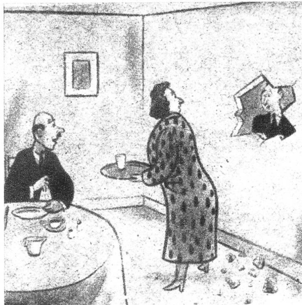
«Excüsi, i ha nume welle e Nagel ischlo!»