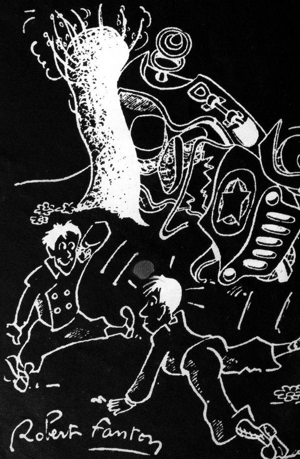
Die Hauptsache. «Okeh, Johnnie! Die Schweizer