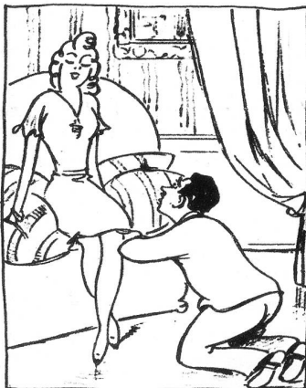
«Du bist unmöglich Henri – such' du zuerst eine Wohnung und dann halte um meine Hand an!»