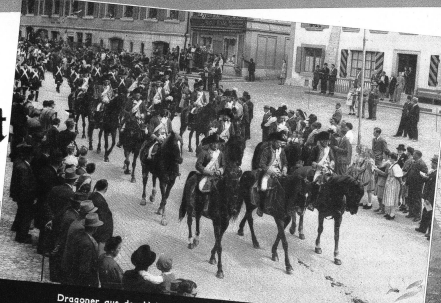
Dragoner aus der Uebergangzeit (Reitverein Biel und Umgebung)