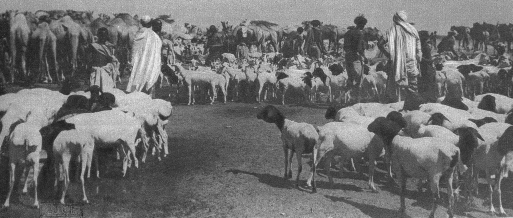
Ein Viehmarkt im ehemaligen Italienisch-Somaliland

fluss, denn die Entstärkung der arabischen Welt am Mittelmeer auf sein eigenes nordafrikanisches Reich gewinnen könnte. Die Amerikaner sind für die Treuhänderverwaltung aller italienischen Kolonien mit Gewährung ihrer Unabhängigkeit nach zehn Jahren, und Molotov, der den russischen Plan vertritt, tendierte ebenfalls nach Treuhänderverwaltung über die italienischen Kolonien, aber nicht durch die Vereinten Nationen, sondern durch Grossbritannien, Frankreich, Russland und die Vereinigten Staaten. In Tripolitanien dem westlichen Kolonialbesitz Italiens, möchte Moskau gerne einen russischen Oberverwalter sehen.