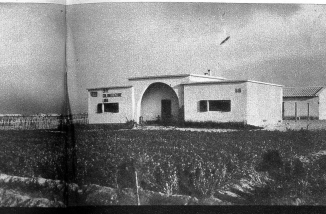
Ein typisches Farmerhaus, wie sie unter der faschistischen Regierung zu tausenden in Libyen entstanden sind.