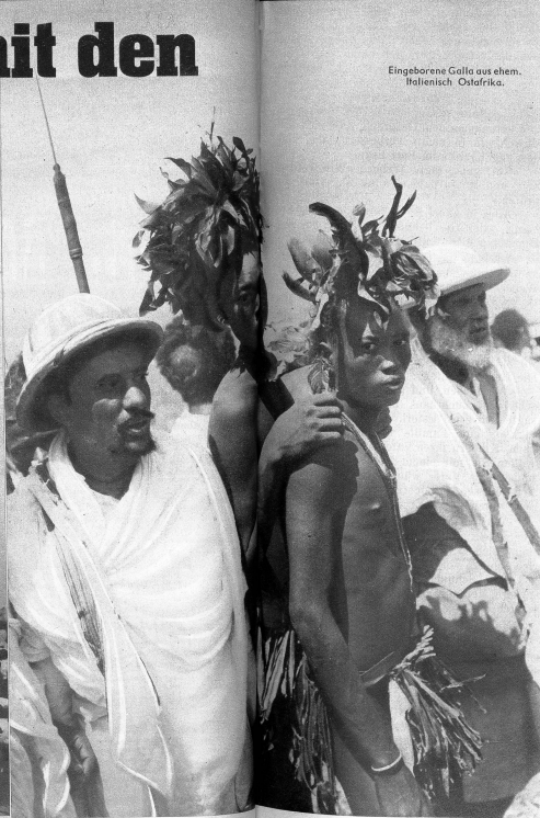
Eingeborene Galla aus ehem. Italienisch Ostafrika.

beide mit dem gemeinsamen Namen Libyen bekannt, und zusammen 2 097 000 Quadratkilometer gross (rund siebenmal grösser als das Italien von 1939). — einen einzigen arabischen Staat (Libyen) mit voller Unabhängigkeit, zu machen. Weiter soll, dem britischen Plan gemäss, Italienisch-Somaliland mit Britisch- und Französisch-Somaliland ein gemeinsames Gebiet (Somalia) bilden, das unter die Treuhänderverwaltung der Vereinten Nationen gestellt werden müsste. Erythra, das abessinische Küstenland, Italiens älteste Kolonie (1895), wird von Abessinien beansprucht. Auch hier handelt es sich um riesige Gebiete: Abessinien 900 000 Quadratkilometer, Somaliland 570 000 Quadratkilometer, Erythra 160 000 Quadratkilometer, zusammen mehr als fünfmal grösser als das Vorkriegsitalien. Frankreich hat einen anderen Plan: es möchte alle italienischen Kolonien einer Treuhänderverwaltung überweisen. Insbesondere ist es aber kritisch gegen die Bildung des arabischen Staates Libya und dessen Unabhängigkeit eingetretet: es denkt hierbei an den Ein-