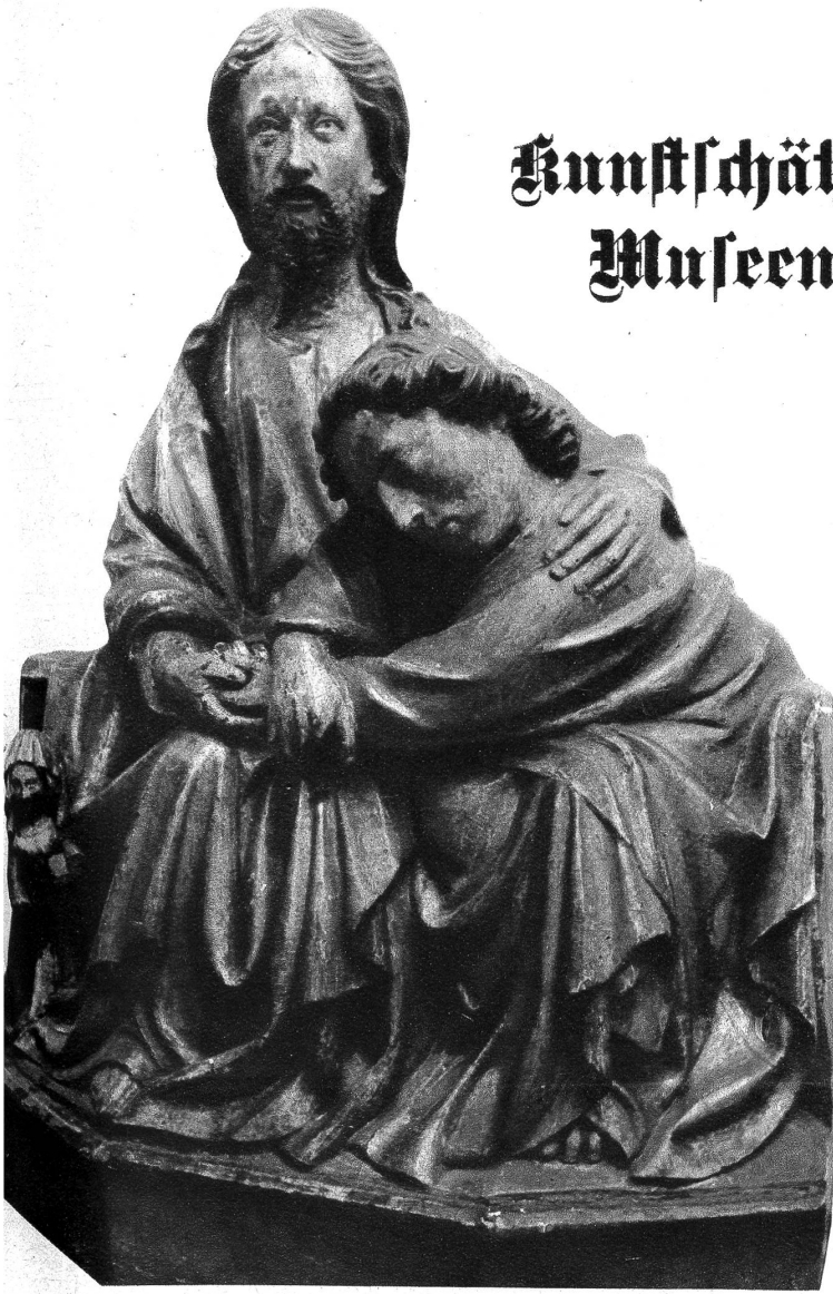
Spätgotische Holzplastik: Christus und Johannisgruppe mit Stifterin. Wahrscheinlich aus dem Colmarer Katharinenkloster. Colmarer Meister um 1430

Rechts: Emmanuel de Witte, 1618—1692: Kircheninneres