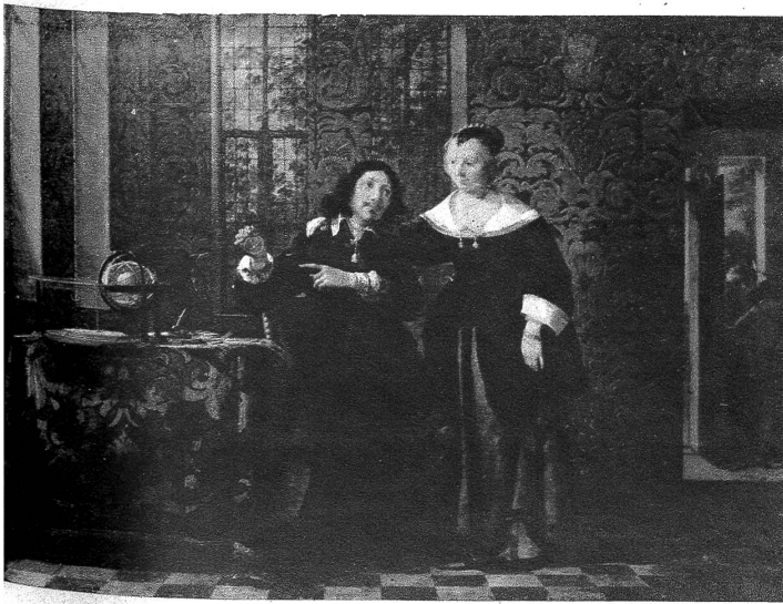
Holländische Schule. Conzaes Coques, 1614—1684; Der Astronom und seine Frau

Rechts: Emmanuel de Witte, 1618—1692: Kircheninneres