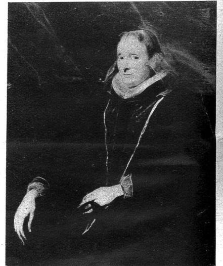
Peter Paul Rubens, 1577—1640: Bildnis einer Dame aus der Familie Durazzo, Jugendwerk aus der Genueser Zeit um 1604—1606