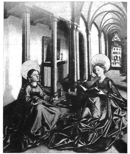
Die Heiligen Katharina und Magdalena, im Kreuzgang des Basler Münsters sitzend. Im Hintergrund durch eine offene Tür sichtbar das Haus und die Werkstatt des Meisters. Von einem um 1440—1445 entstandenen Altar, zu welchem auch die Nürnberger Verkündigungstafel und die «Begegnung an der goldenen Pforte» im Basler Kunstmuseum gehören