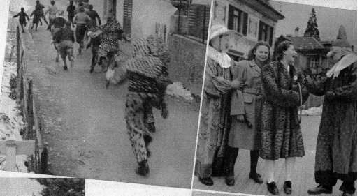
Oben: Eine «Röllis»-Gruppe auf der Jagd nach Büben, die laut kreischend das Weite suchen