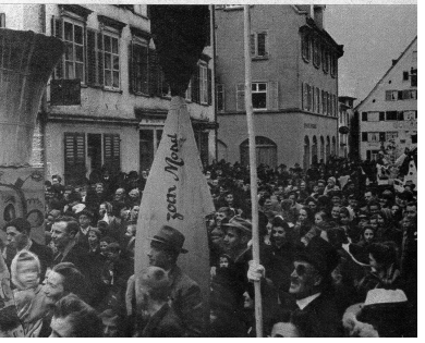
Kopf an Kopf steht die Bevölkerung in der Hauptstrasse, wenn der Umzug kommt und die Schnitzelbankleute ihre Sprüche loslassen