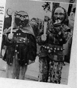
Rechts: Zwei kleine «Röllis» die den grossen in nichts nachstehen möchten. Vor ihnen sucht jedoch kaum jemand das Weite