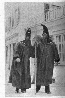
Zu den traditionellen Fasnachtserschneidungen in Wallenstadt gehören auch die Dominos. Diese eher mysteriösen Gestalten scheinen jedoch im Aussehen begriffen zu sein, da man sie nicht mehr so viel antrifft wie früher.

nicht mehr nehmen lassen würden. Da werden auf kunst- und einfallsreich ar-rangierten und aufgebauten Wagen die aktuellen Probleme auf köstliche Art unter die Lappe genommen und durch den Kakao gezogen. Selbst die Honorati-onen der Gemeinde müssen an der un-nachtstlichen Fastnacht allerhand ver-dausen können und über eine dicke Haut verfügen, wollen sie all die Scherze ruhig über sich ergehen lassen. Aber eines ist gewiss — für jung und alt ist hier die Fastnacht das grösste Fest des Jahres, an dem jeder ungeübert sagen kann, was ihm beliebt, und an dem man allent-halten 9 gerade sein lässt, ohne dass irgendwo böses Blut aufsteigt. An der Wallenstädter Fastnacht da führen nur die «Butz» das Regiment!