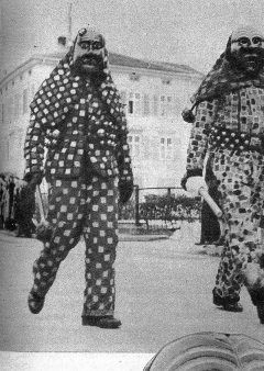
Eine der alten Gemeindemasken, die zum Stolz der Gemeinde Wallenstadt gehören und nur von Aus-erwählten getragen werden dürfen.

Stitte «hoch» nimmt. Hier gehört das seit alters her zur eingetragenen Fast-nachtstradition, und die wird, wie nicht gerade etwas anderes, hoch in Ehren gehalten. Zu dieser Tradition gehö-ren aber vor allem die von den Kindern, oft sogar auch noch von den Erwach-senen, gefürchteten «Röllis» im bunten Blättelkleid und mit grün-rot karierten Kopftüchern und Rollengurt angetan. Sie tragen fastnachtstypische, kunstvoll ge-schnitzte Holzlarven, deren angele-rtens Grimassen phantasievoll aus-gesah sind. Die kostbaren alten Lar-ven sind Eigentum der Gemeinde, des-halb nennt man sie auch Sourszchand «Gemeindelarve». Diese Röllibutzen» er-füllen ursprünglich mehr sittenpoli-tische Aufgaben. Mit einer Art Holzkeule oder seltener auch mit einer Schwene-blase bewaffnet, jagen sie am Abend die Kinder nach Hause und vertrieben lichtcheues Gesindel. Ueberlieferungs-getro sind sie auch heute noch hinter den Büben her, von denen mancher von kilometerweiten Hetztreiben berichten kann. Aber alle Burachen sehen sich natürrlich darnach, selber einmal in der Aufmachung eines «Röllis» triumphi-erend zu können. Eine neuere Errechnung ist vielleicht der ulkige Fastnachtsumzug, den sich die Wallenstädter heute auch