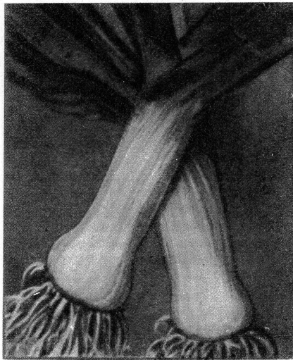
Winter-Lauch Elbeuf, monströser Riesen

Rübkohl (Kohlrabi) fr. weisser Roggli; fr. weisser und blauer Wiener; sp. Goliath und Speck, zum Einlagern; Kabisrüben (Erdkohlrüben), gelbe Schmalz.