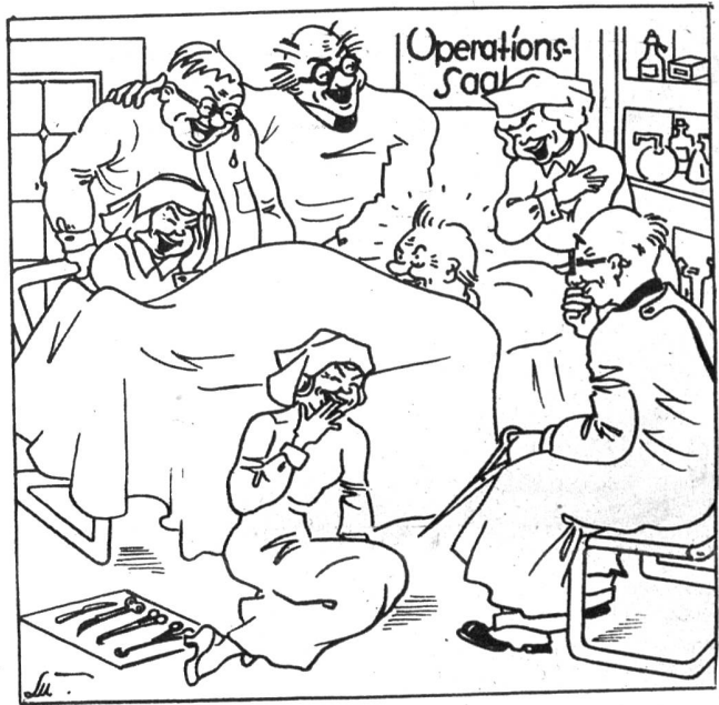
Ein Komiker soll operiert werden