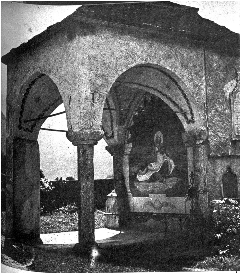
Friedhofkapelle in Bignasco (Valle Maggia)