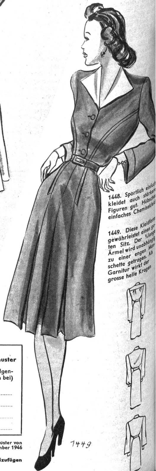
1449. Diese Kleidform gewährleistet einen guten Sitz. Der \frac{3}{4} lange Ärmel wird unabhängig zu einer engen Manschette getragen. Als Garnitur wirkt der grosse helle Kragen