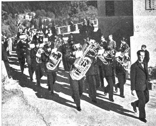
Der festliche Zug der Sennen unter Begleitung der Dorfmusik bewegt sich hinab auf den Festplatz vor der Kirche in Bürglen