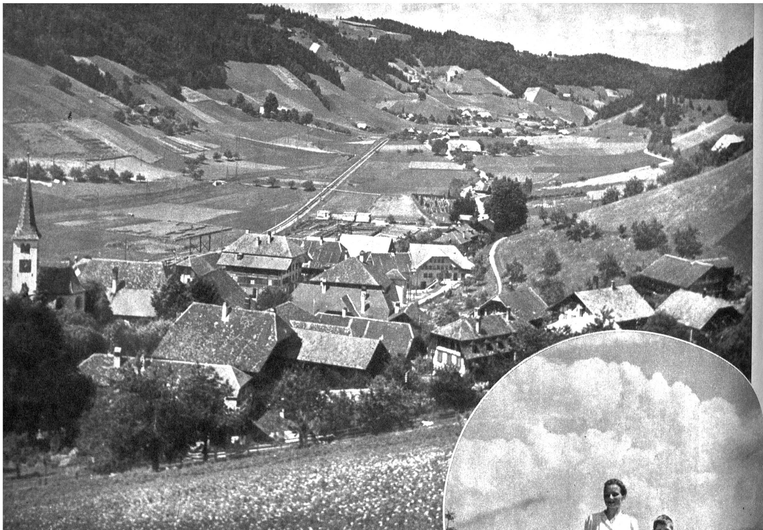
Oben: Walkringen liegt schön eingebettet zwischen bewaldeten Emmentalerhügeln Rechts: Bummel über einen der vielen „Emmentalerhoger“