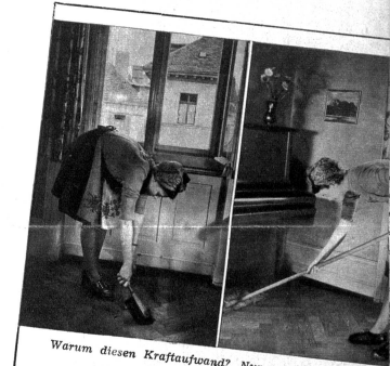
Warum diesen Kraftaufwand? Nur um den Staub zusammenzukahren?