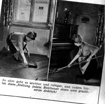
So aber geht es leichter und ruhiger, und zudem blättert diese Stellung jedem Beschauer einen weit grässlicheren Anblick!