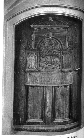
Alte Renaissanceüre aus der ersten Hälfte des 17. Jahrhunderts am Hause Gerechtigkeitsgasse 19, auf die die Bewohner der Gasse besonders stolz sind