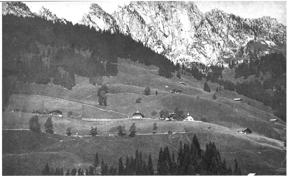
Das Dörfchen Abläntschen mit den Gastlosen im Hintergrund