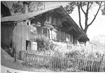
Das Pfarrhaus in Abläntschen