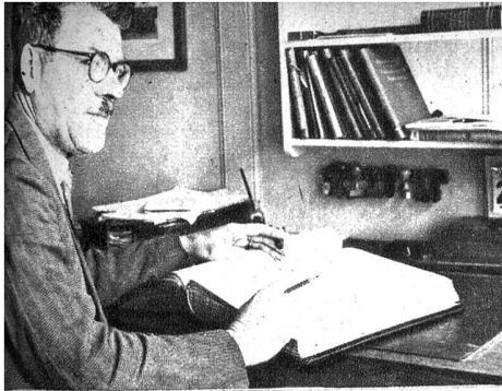
Der Amtsschreiber und Amtschaffner an seinem Arbeitsplatz