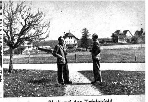
Blick auf das Tafelenfeld