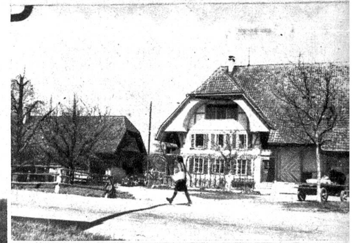
Ein schöner Bauernhof