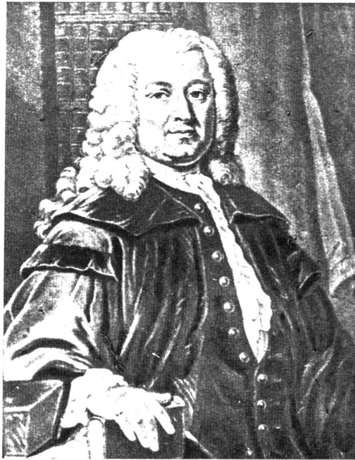
Albrecht von Haller, 1708—1777

Hallers Schriften, in denen er eine Fülle eigener Beobachtungen und Entdeckungen mitteilt, und die Ansichten seiner Vorgänger einer kritischen Prüfung unterzieht, erstrecken sich auf die Gebiete der Anatomie, Physiologie und Botanik. Hallers Forschern ging von der Anatomie aus, die ebenso wie die Botanik seinem Bedürfnis nach nüchterner Betrachtung der Tatsachen entgegenkam. Von hier aus gelangte er zur Physiologie, der er sein