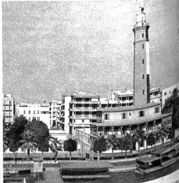
In Port Said, am Eingang zum Suez-Kanal tritt den Reisenden das Morgenland in ausserordentlich sinnlichen Bildern entgegen