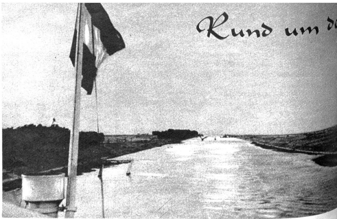
Zwischen endlosen Flächen braunen Wüstensandes gleitet das Schiff durch den Kanal

Der Junge hat sicher recht. Beides ist wahr: die Flasche ist halbvoll, aber auch halbleer gewesen. Ich hatte doppelt recht — die Pessimisten haben meist immer unrecht. Ihre Gesichtspunkte gehen von falschen Voraussetzungen aus. Ich sage zum Beispiel lieber, mein Mann habe eine sehr hohe Stirn als: «Er hat eine schon beginnende und frühzeitige Glatze». Er hat eine wunderbare Stirn. Und ich habe ihn gerade gern mit seiner übermäßig hohen Stirn, die zu ihm gehört. Und seit ich die Probe mit der Flasche bestanden habe, glaube ich doppelt daran, dass es richtig ist, wie ich denke. Der Trick mit der Flasche könnte ja auf unzählige Fragen im Leben angewandt werden, und ich möchte immer auf der rechten Seite stehen. Vielleicht entgegenen Sie mir, das sei ein loses Spiel mit Worten. Aber Sie haben unrecht: die Menschen sind und werden so, wie wir mit ihnen umgehen, und was wir aus ihnen machen. Wohin kämen wir mit unserer Liebe, wenn die Flasche immer halbleer wäre? Zum Optimismus gehört die Kraft der Liebe. Sie lässt uns die Flasche halbvoll sehen, wenn sie in Wirklichkeit ebenso halbleer ist. Und wie steht's mit demer, mit Ihrer Flasche...? E. I.