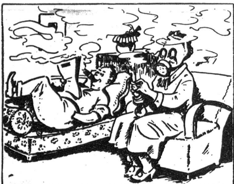
„Nun kannst du qualmen, so viel du willst.“

Am Morgen nach dem Fest sieht Blum in den Spiegel. „Höre mal, Marie“, sagte er zu seiner Frau, „ich habe hier auf der Zunge eine ganz scheussliche Blase, sieht aus wie verbrannt.“ — „Kein Wunder“ meint Frau Blum, „heute nacht, wie du heimgekommen bist, wolltest du ja unbedingt aus der Wärmeflasche auf meine Gesundheit trinken.“