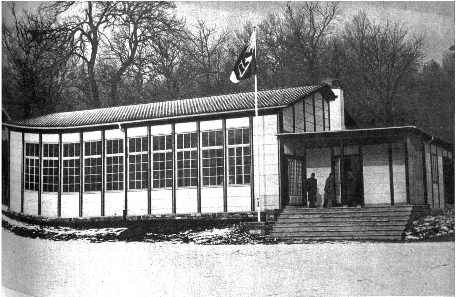
Sportplatz und Uebungshalle der Universität Bern

Rechts: Der Hochschul-Sportlehrer erläutert eine Phase der körperlichen Uebung. Die neuartige, in der bewährten Durisol-Leichtbauweise konstruierte Uebungshalle mit viel Licht und Luft wirkt befreiend gegenüber den alten Turnhallen, die wie Keller-gewölbe und Bunkerbauten anmuten