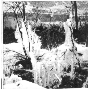
Die Eisbildung an den Baumästen ist eine Notwendigkeit, zumal man durch sie die 80 Kalorien Wärme (pro Kilo Eis) oder, wie der Physiker sagt, die sogenannte latente Schmelzwärme erreicht