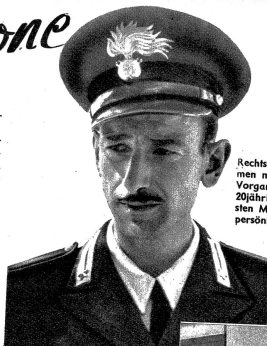
Der Polizist soll die ruhige Abwicklung der Wahl überwachen. Er hat nicht viel zu tun, da es bei der kleinen Bevölkerung keinen Andrang gibt.