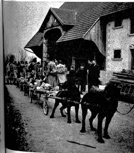
Links: Rottweiler als Traktionshunde