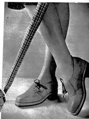
Hübscher Sportfrotteur in schöner Passform und modernem Sellenverschluss