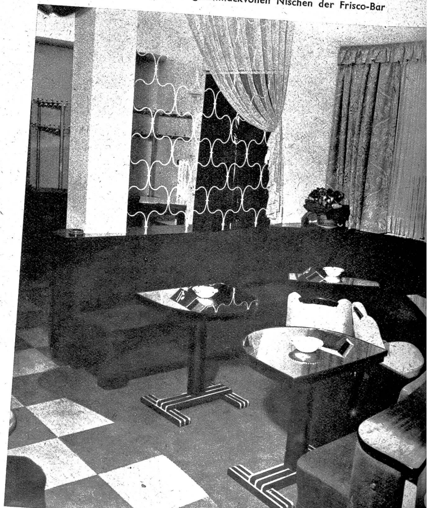
Eine der geschmackvollen Nischen der Frisco-Bar