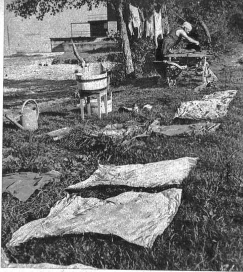
Im Gras und an der Sonne kann die Wäsche gut trocknen und wird schneeweiss