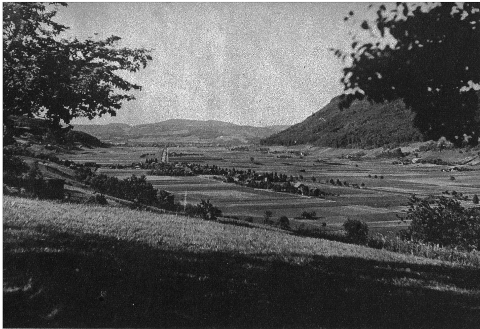
Blick ins Gürbetal gegen Belp. Man kann auf diesem Bilde sehr gut die für das Tal so wichtige Korrektion der Gürbe ersehen