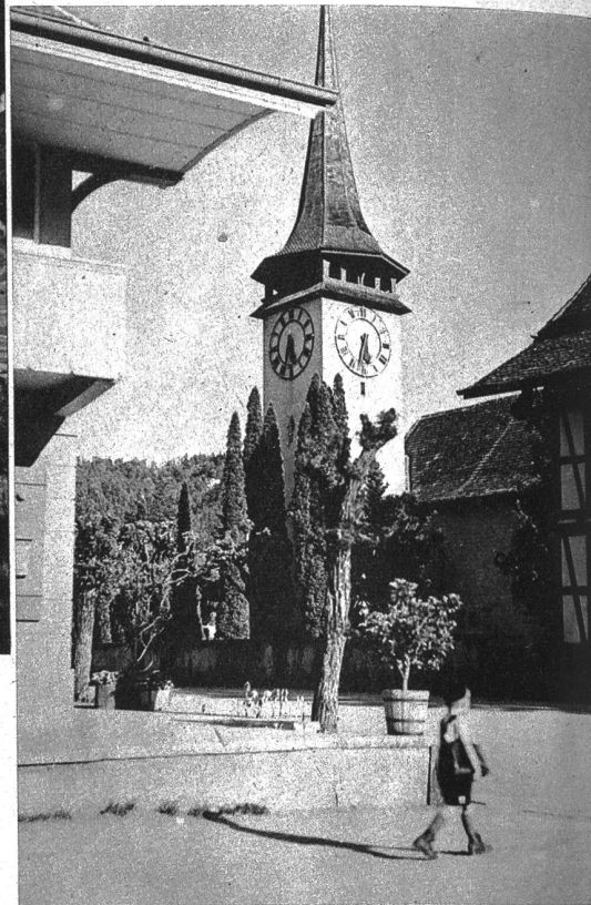
Die Kirche von Belp

D'Butzeschybli vo de bhäbige Purehüser hei ir rote-n-Abe-sunne glänzt wie Schpiegle. Vo Toffe här si grossi Schatte-n-über ds Thal i cho. D'Gürbe hett-sich wie nes silberigs Band dür die sumpfige Matte-n-us gschlänglet u vo allne Syte chlyni Wasser-Aederli ufgno. E schöne Schpätsummer-Tag isch z'Aend gange, d'Frösche-n-im Moos hei Konzärt gäh u wie-nes grosses Füür hett ds Alperot uf dr Stockhornchötti brönnt. Irgetwo hett eine agfange tängele, e zweute-n-isch igfalle, e dritte u nah-di-nah si bi jedem Purehus die Sägesse für e morndrige Tag früsch gschärft worde u das melodische tagg-taggtagg hett luschtig dür die ganz Heitere-n-us tönt. D'Froue si vor-usse ghocket u hei ärschtig z'Märit grüschtet. Dr Aetti hett ungerdesse dr gross Zweirädercharre vüregno u ne no rächt brav gsalbet, drmit es de am Morge echli ringer gäge Bärn zue göng. Syder isch ir Chuchi ds Nacht zwägmacht worde, ds Müetti hett e schlegeldicki Händöpfelsuppe-n-ufgschtellt, wo dr Löffel poutzgredi drin gschtange-n-isch, drzue hetts e Bitz schwarzes Brot u magere Chäs gäh u zletscht no ne grossi Chachle blaiu Milch, um alls zäme-n-ache zschwäiche. Me hett-no Zyt gha früecher zum Aesse, es isch e fyrlecheri Agläge-