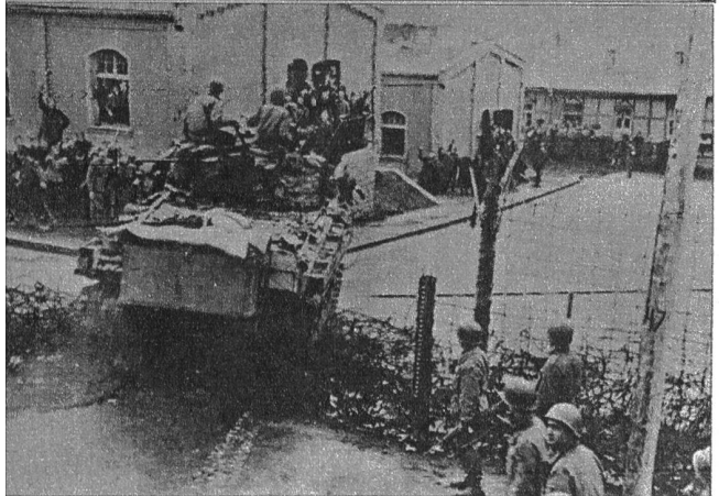
Links: Auf ihrem Vormarsch ins Deutsche Reich haben die Alliierten bereits viele deutsche Kriegsgefangenen- und Interniertenlager besetzt, wobei das ungeheure Elend, das dort herrschte, zutage trat. Unser Bild zeigt einen amerikanischen Tank, der durch die Stacheldrahtverhaue in ein Kriegsgefangenenlager eindringt