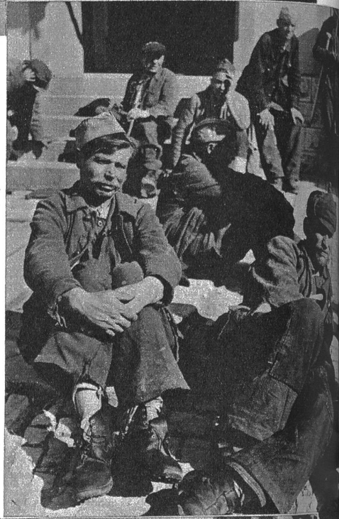
Rechts: Russische Fremdarbeiter nach dem Übertritt auf Schweizergebiet. Müde von dem langen Marsch bis zur Grenze liessen sie sich kurzerhand auf der Strasse nieder zum Ausruhen