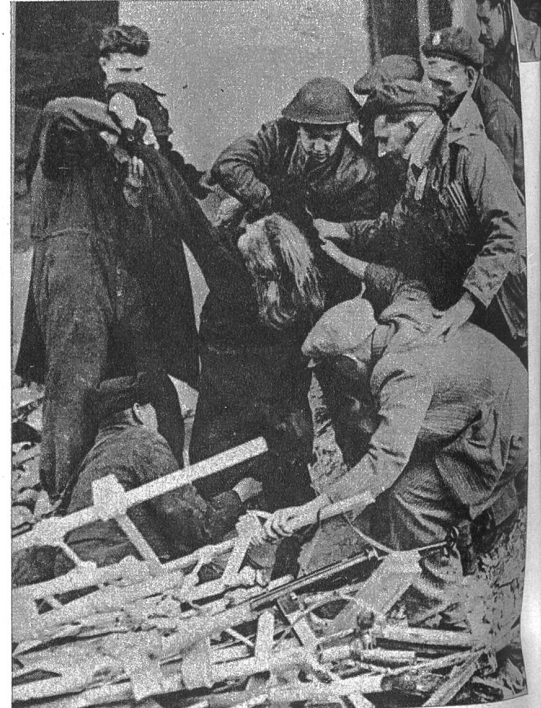
Die Untat eines „Werwolfs“. Aus einem Lager befreite russische Fremdarbeiter erhielten von der Besatzungsbehörde in Osnabrück die Erlaubnis, ihre zerlumpte Kleidung in einem unterirdischen Warenhaus gegen neue Kleider zu vertauschen. Eine grosse Zahl von Russen und Russinnen stieg in den Keller hinunter. Ein Polizist, den man im Dienst belassen hatte, zündete in diesem Moment das Lager an, so dass die Russen in Gefahr schwebten, zu verbrennen. Unser Bild zeigt die Bergungsarbeiten