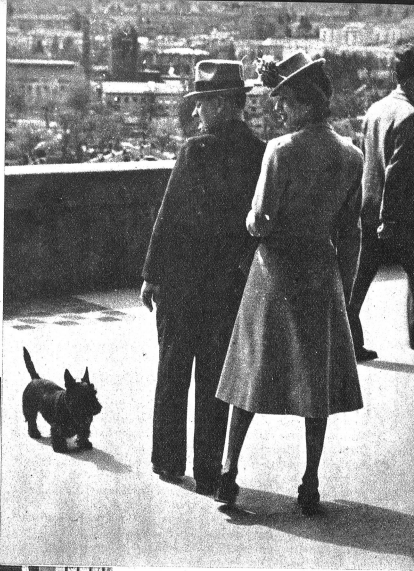
Sie, Er und ein Kowä-Hund

Das ist natürlich die Bundesterrasse und die Kleine Schanze in Bern.