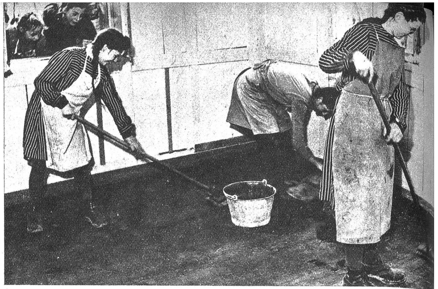
Der Fussboden wird von den Schülerinnen „gribblet“