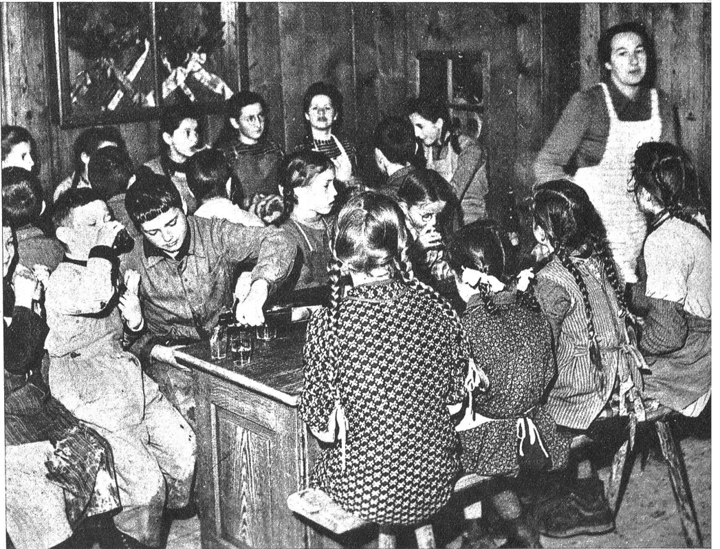
Rechts: Am Tage der „Usewäsetete“ gibt es für die fleissigen Teilnehmer und Teilnehmerinnen auch eine spezielle Verköstigung