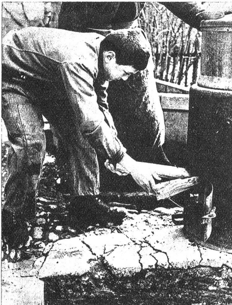
Pierrot, einer der grösseren Schüler, betreute bei der letztjährigen „Uewäschete“ den „Dämpfer“, das Wasserkessi