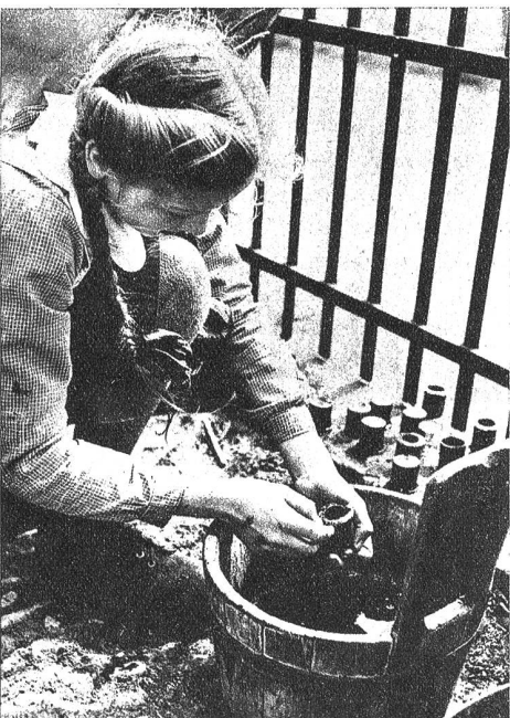
Die Tintenfässchen müssen auch gereinigt werden