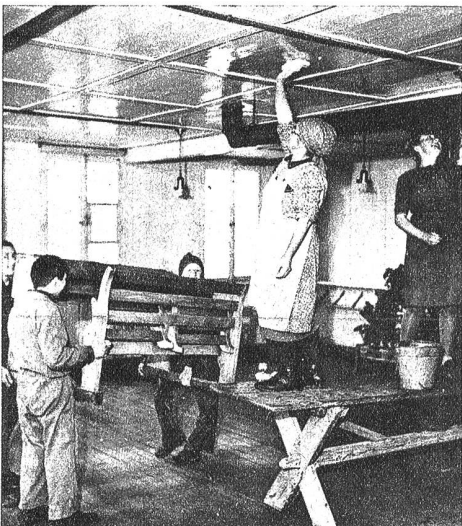
Putzfrauen werden von der Gemeinde gestellt, welche die Schulstubebedecke zu fegen haben