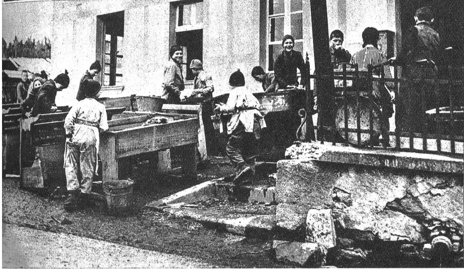
Immer beim „Usewäsche“ gibt es fröhlichen und schaffigen Betrieb vor dem mit einem Türmchen gezierten Lurtiger Schulhaus