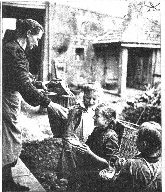
Die Kinder gehen mit Hutten in die Bauernhäuser und laden die Leute zum Besuch der Examen ein. Gleichzeitig „betteln“ sie um einige Gaben fürs „Zimmis“ während der „Useputzete“