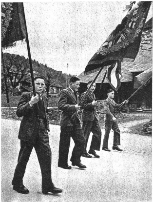
Vier stramme Neuntklässler führen den Umzug an

Rechts: Ich bin ein Schweizerknabe! Jeder Dorfjunge sichert sich oft schon Wochen vor dem Examen bei Bekannten oder Verwandten eine Fahne