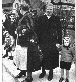
Mütter mit dem Nachwuchs, bereit, das Defilee abzunehmen