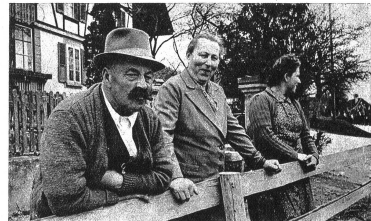
Meister Georg, ein ehemaliger „Schulkommissionler“, beobachtet kritisch, ob sich alles wie früher abspielt