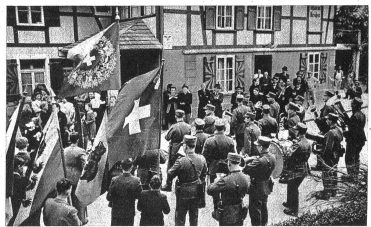
Die einzige Dorfwirtschaft ist bereit! Denn nach dem Umzug dürfen die Schüler im Saal einige Tänzlein probieren, wobei es einzig auf die damit verbundene Freude ankommt. Dazwischen schallen die munteren Lieder der Klassen und ergänzen allfällige Kurzaufführungen