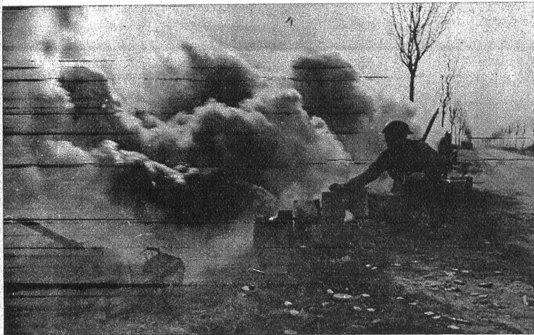
Vernebelung aus Nebelbüchsen am Rheinufer. Ein britischer Infanterist überwacht ihr Funktionieren