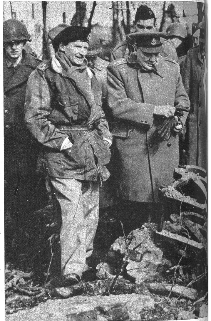
Feldmarschall Montgomery und Ministerpräsident Churchill im Kampfgebiet am Niederrhein