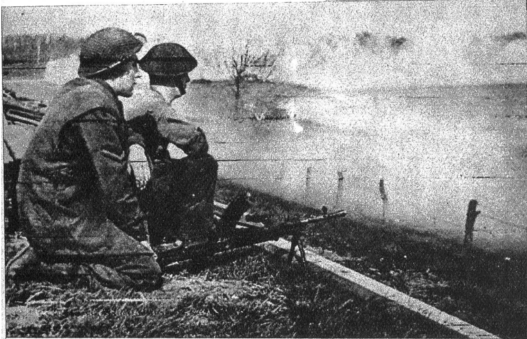
Ein britischer Maschinengewehrposten am Rhein, gedeckt durch die künstliche Nebelwand, bereit zum Feuerschutz für die über den Strom setzenden Einheiten